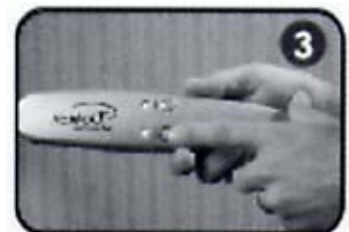
3. 按"Power"钮一次, 然后按"Laser"钮一次已启动健发梳。