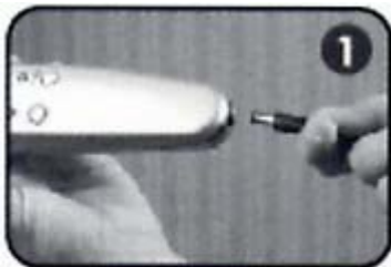
1. 把变压器的电源输出接头插入雷射健发梳。

我们建议雷射健发梳使用在洗净的头皮上。你的头发可以是湿的、吹风机吹干的或是用毛巾擦干的。雷射健发梳应该在使用任何作用在头皮上的发胶、外用生发水、喷发胶或是喷雾假发类产品前使用。